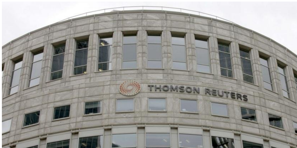
=صورة المبنى الرئيسي لوكالة ثومسون رويترز=

وتقدم الوكالة خدماتها بـ10 لغات، وتوظف حاليا أكثر من 60000 موظف، بينهم 2500 صحفي، وتضم مكاتب موزعة على 93 دولة، ولديها أكثر من 40000 زبون حول العالم، وهو ما ساعدها على تحقيق رقم أعمال تجاوز 12,5 مليار دولار. (29)