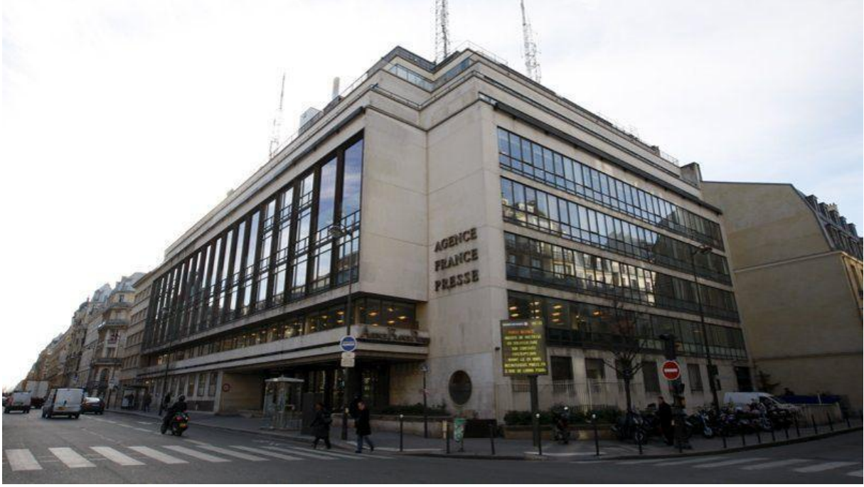
=صورة المبنى الرئيسي لوكالة الأنباء الفرنسية=