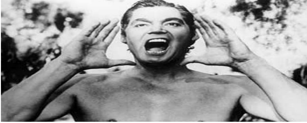
=صورة من فيلم "طرزان" المصور في الجزائر سنة 1932=

عرفت الجزائر السينما متأخرة مقارنة بمصر، رغم أنها كانت محطة تصوير وإنتاج العديد من الأفلام الفرنسية والعالمية خلال الحقبة الاستعمارية، ومن بين تلك الأفلام: فيلم "البلد" (Le Bled) سنة 1929، وفيلم (Golgotha) سنة 1935، وفيلم "قيصرية" و"الإسلام" سنة 1949، بالإضافة إلى الفيلم الأمريكي الشهير "طرزان" (Tarzan) سنة 1932. (53)