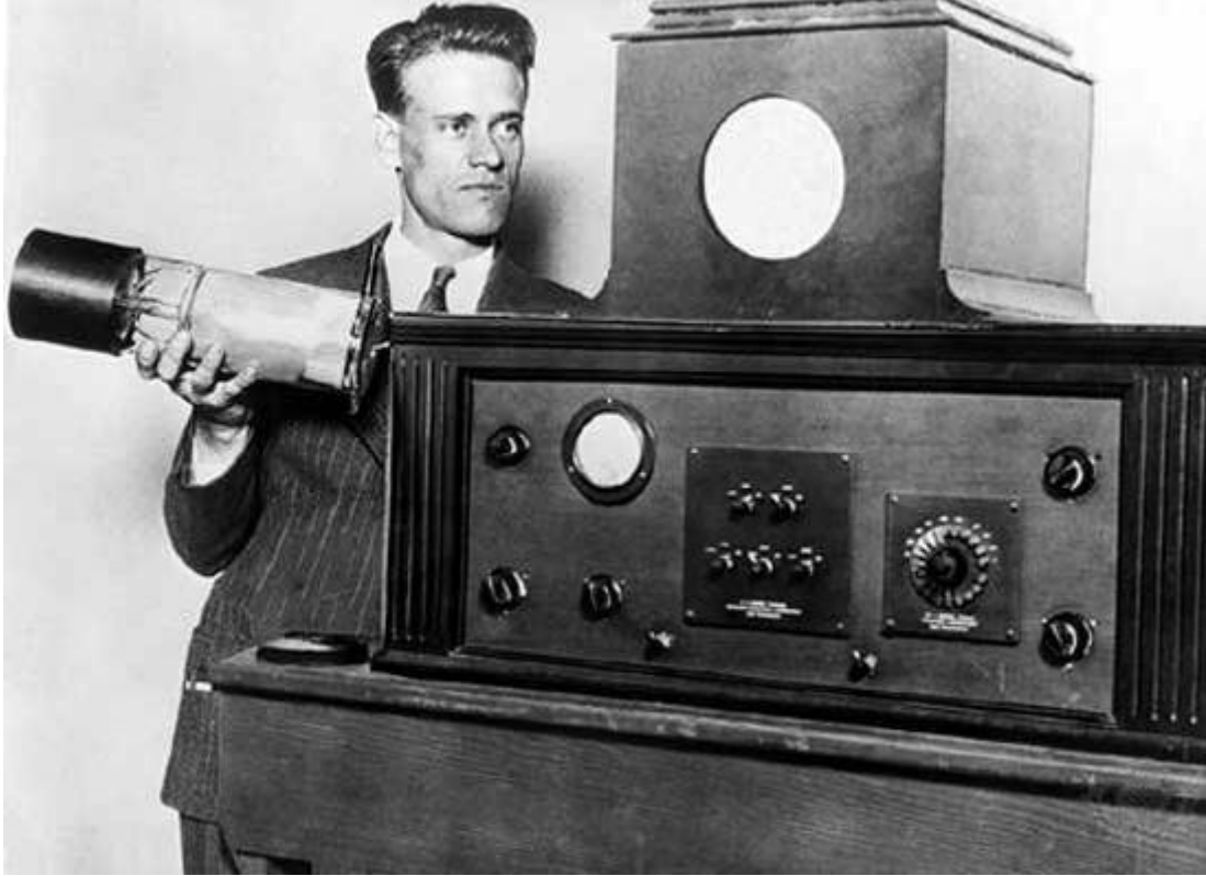
=صورة للنسخة الأولى من تلفزيون "زفوريكين" بنظام الكتروني=