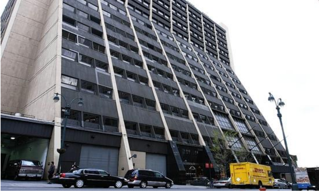
=صورة المبنى الرئيسي لوكالة أسوشيتد برس=