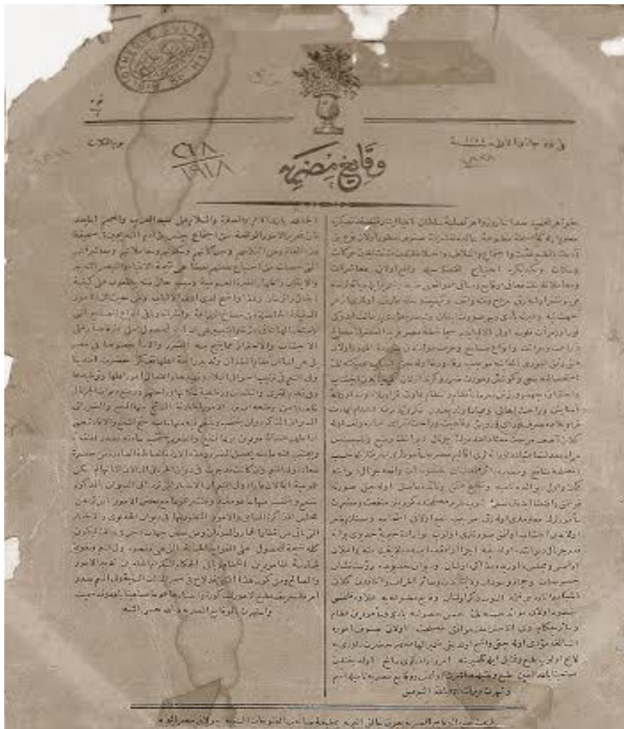
=صورة لاحدى صفحات جريدة الوقائع المصرية=

وانتظر العالم العربي إلى غاية 3 ديسمبر 1828 ليتم إصدار أول جريدة عربية (أي تحت إشراف عربي كامل) في مصر على يد "محمد علي باشا" سماها "الوقائع المصرية" (9) ، مستفيدا من إنشاء أول مطبعة عربية وهي "مطبعة بولاق" سنة 1820، وصدرت الجريدة باللغتين العربية والتركية، وكانت عبارة عن جريدة رسمية نصف شهرية توزع على موظفي الدولة وضباط الجيش والطلاب لإعلامهم بقرارات الوالي آنذاك. وتعتبر جريدة "الوقائع المصرية" - إضافة إلى كونها أول صحيفة عربية - أقدم صحيفة عربية حية أيضا، إذ لا تزال تصدر إلى يومنا هذا في شكل ملحق للجريدة الرسمية المصرية تعنى بنشر القرارات الحكومية المختلفة.