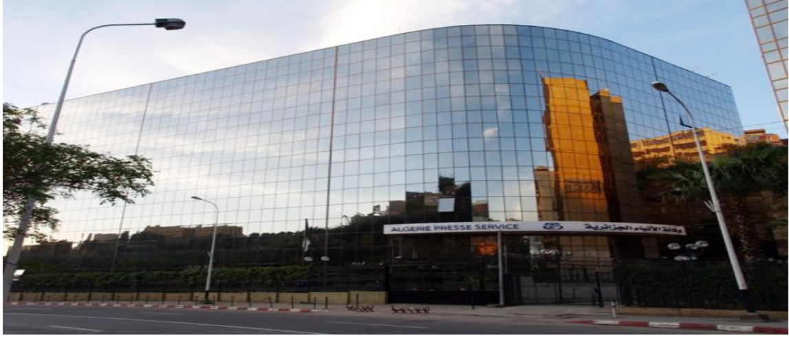
=صورة المبنى الرئيسي لوكالة الأنباء الجزائرية=