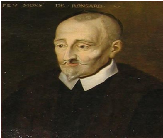
Pierre de Ronsard