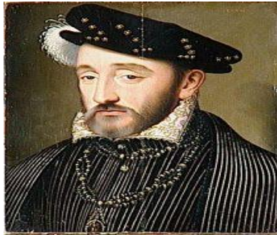
Joachim Du Bellay

Les imprimeries se multiplient grâce aux privilèges royaux obtenus par les éditeurs. La plupart des écrivains y publient leurs œuvres. En 1500, on compte quarante librairies (lieu où on imprime, édite et vend les livres) en France. Quarante villes sont dotées d'une librairie chacune. Le livre en format réduit se répand favorisant le goût pour l'érudition et la diffusion des idées humanistes.